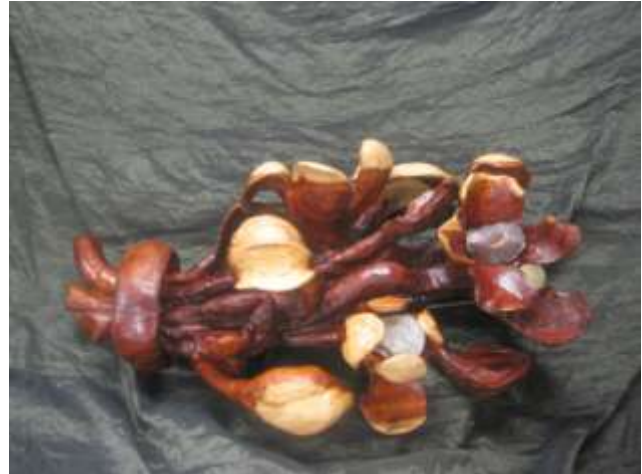
Broche in taxushout.