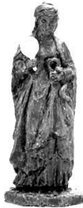
Model in boetseerwas.