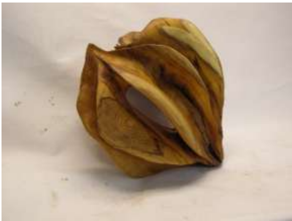
Zaadje in taxushout

Na het maken van de totempaal ging ik werkstukken in reliëf maken, zoals een zonnebloem en een vlinder in notenhout. Maar al snel legde ik de lat een stukje hoger en ging ik driedimensionale beelden maken. Op een dag kwam er iemand snijden die grote dingen ging maken en ik dacht, dat wil ik ook! Ik ging beelden maken van vormen uit de natuur, zoals een knopje van een bereklauw en een zaadje van een hemelboom maar dan wel sterk vergroot .