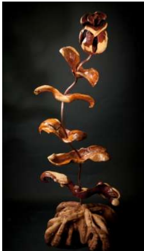
Plant in taxushout, wortels van iepenhout, ongeveer 1.5 meter hoog