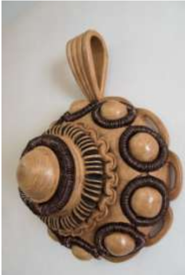
Zeeuws knopje, 60 cm diameter.