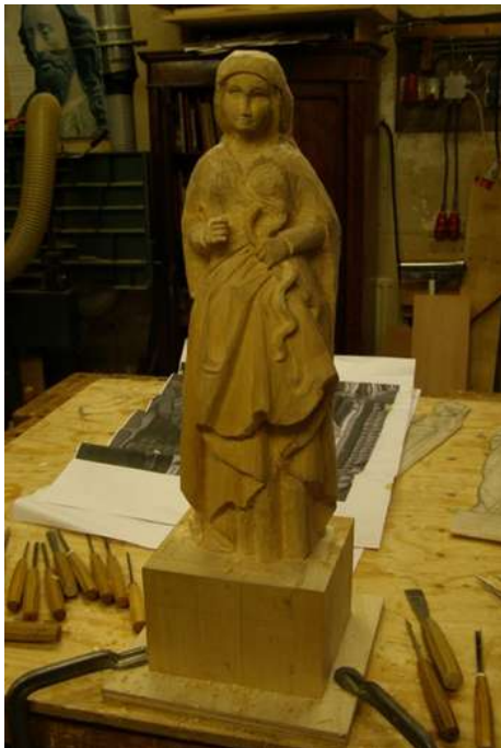
De grote lijnen zitten al in het hout.

Ik ben begonnen met het snijden van Vrouwe Voorzichtigheid in lindenhout. Op deze foto zie je dat de grote lijnen er nu in zitten. Dit was het meest lastige deel om te snijden omdat dit werk bepaalt of het beeld gaat lijken op het origineel. Nu ben ik zo ver om de details verder uit te werken. Het lijkt langzamer te gaan, ik produceer minder houtkrullen, maar elk detail dat ik toevoeg maakt het beeld levendiger. De spiegel voeg ik toe wanneer de jurk klaar is, zo zit deze niet in de weg bij het snijden van de jurk.