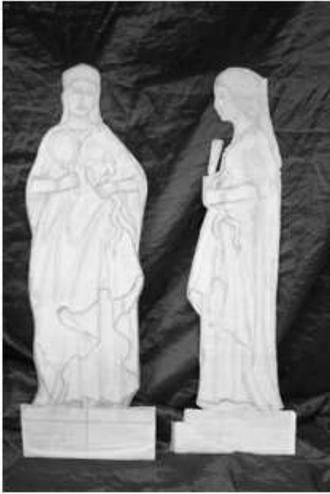
Ontwerp voor- en zij aanzicht op papier.